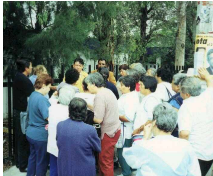
AYUDA A LA TERCERA EDAD

reunió con un grupo de la tercera edad que lo habían invitado a una reunión con gente de una escuela donde van a hacer ejercicio, son personas que sufren de diabetes e hipertensos, uno de los le comento sobre ellas, pero no se pudo hacer la reunión dentro de la escuela, la directora argumento que eran órdenes de Rosario Robles que en ninguna institución se podía hacer proselitismo. Todos se salieron y fueron a ver el lugar que les habían prometido dar para hacer sus ejercicios. Este terreno en un centro de salud que se encuentra abandonado y no tiene mantenimiento.