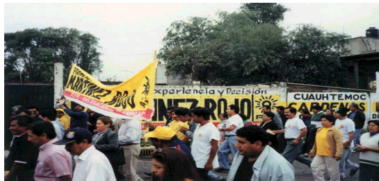
RECORRIDO EN LA COLONIAS

En las campañas estudiadas 1997 y 2000 se hizo énfasis en las estrategias acerca de que la relación de los ciudadanos y los candidatos, de ahí la importancia de conocer los derechos de los primeros en ejercer un voto, participar como electos o en el gobierno y poder, asociarse, reunirse con fines políticos y expresar libremente sus ideas, y recibir la información requerida de las cuentas sobre la administración del gobierno. Es bien sabido que son pocos interesados en hacer valer sus derechos políticos, es un mucho más visible el ejercicio de estos derechos durante las campañas electorales, como fue el caso en delegación Tláhuac.