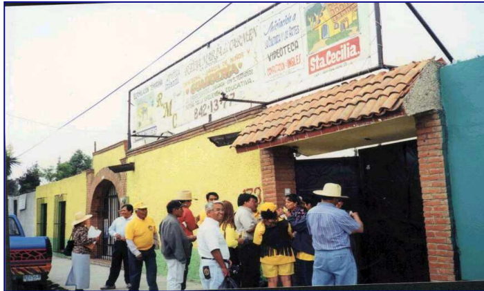
RECORRIDO EN ZONA DE ESCUELAS

agradecer el apoyo y pide que no se olviden de él y que es un ciudadano más y un tlahaquense.