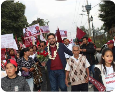
Ozumba / Política