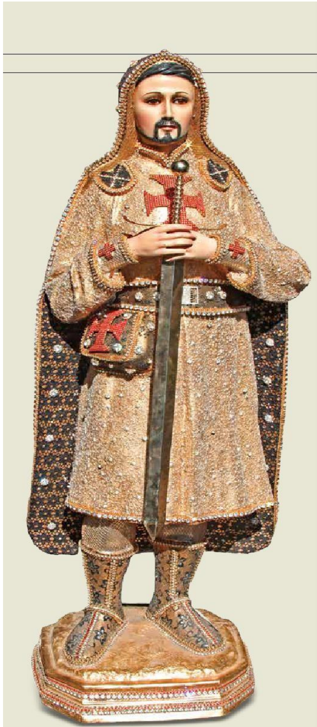
Anexo 1: Estatua de “San Nazario”, basada en Nazario Moreno González, líder de Los Caballeros Templarios al que se dio por muerto por las autoridades y que, sin embargo, siguió con vida. Esto dio pie para reforzar su imagen como un santo, del cual se construyeron altares en diferentes localidades de Michoacán, reforzando así el control territorial templario.