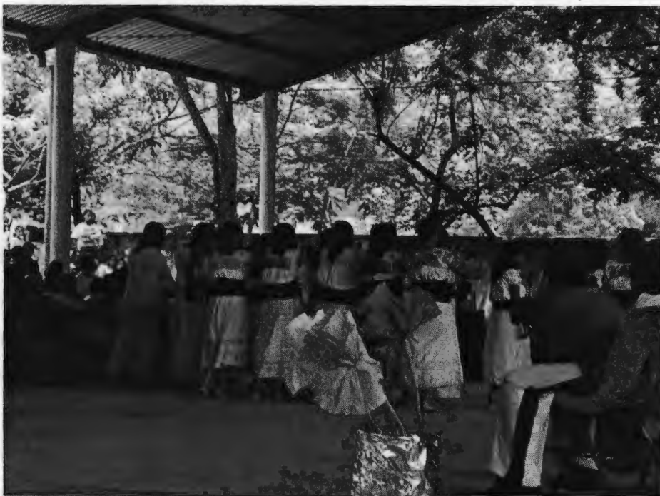
Representación de danza tepehua en clausura de cursos escolares.

Mis respuestas a esta preguntas se dieron a partir de observar los procesos de escolarización de los niños y el papel que la población le concede a la escuela.