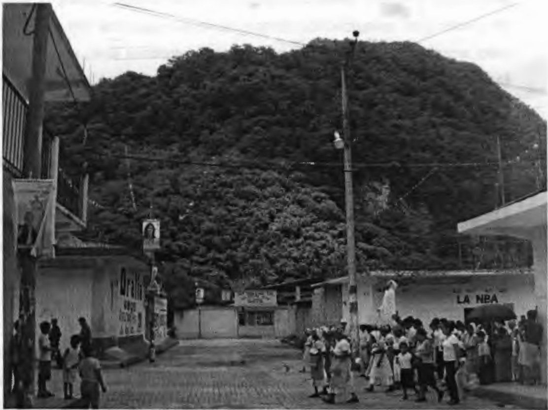
En procesión del Santo Patrono del pueblo

Las fiestas y acontecimientos importantes que marcan la vida colectiva de los tepehuas, ha transcurrido entremezclada —como la de muchos otros grupos indígenas a partir de la conquista— con la realización de costumbres que identifican como propias, de los “antiguas” y las promovidas por la iglesia católica.