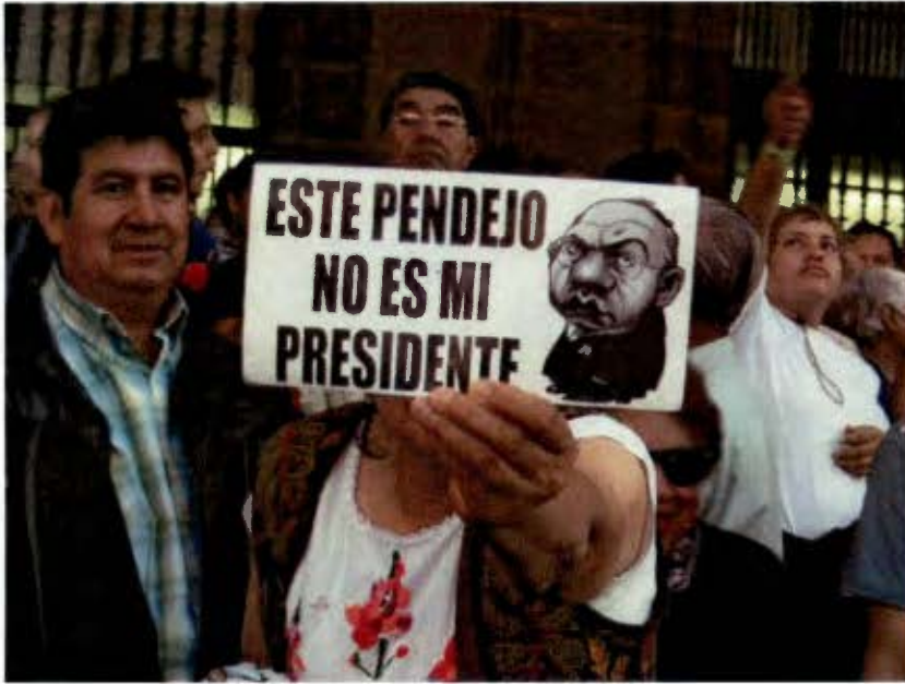
La indignación contra el fraude, base común del colectivo (febrero 2008)