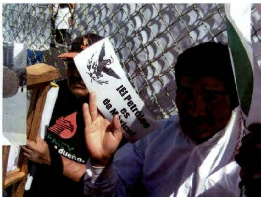
La organización por la defensa del petróleo como un bien nacional (Febrero 2008)