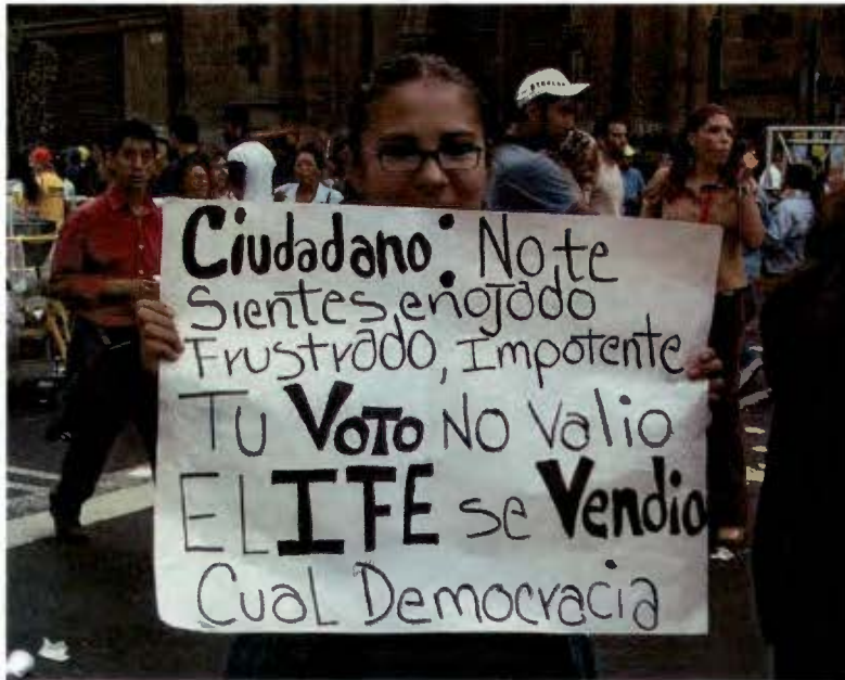
A cuatro días del proceso electoral en 2006, la gente salía a protestar por los resultados preliminares (8 Julio 2006)