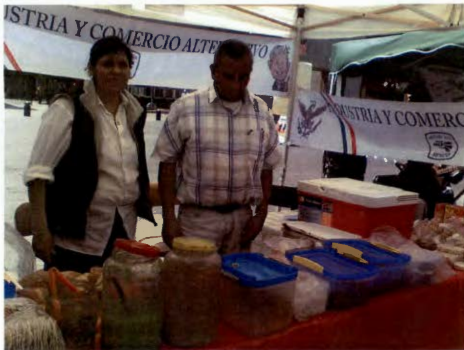
La Resistoritas. Hemiciclo a Juárez, Octubre 2010.