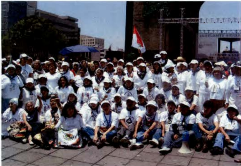
La Brigada 8 en el Monumento a la Revolución (Agosto de 2008).