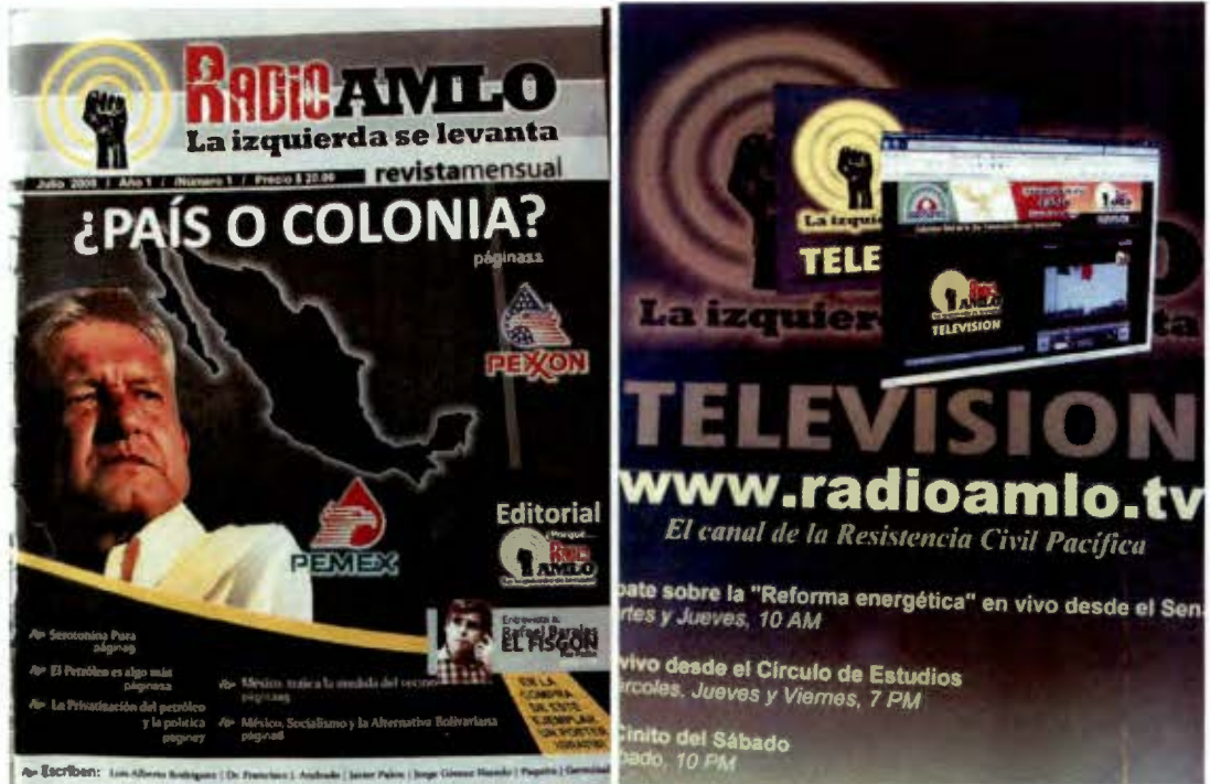
Único Número de la Revista de Radio AMLO Julio 2008. En la contraportada se anuncia su canal de televisión.