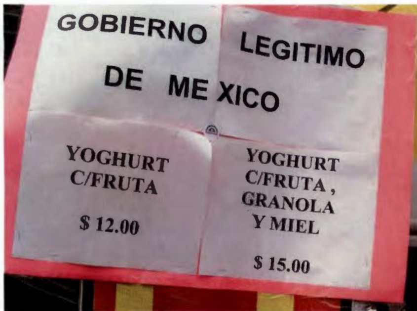
Consumo y Venta del obradorismo. Zócalo de la Cd. De México Junio 2008