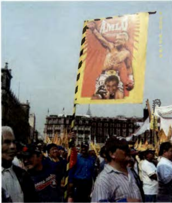
La indignación continúa a lo largo del año 2007. La imagen muestra la llegada a la Tercera Convención Nacional Democrática (Noviembre 2007)