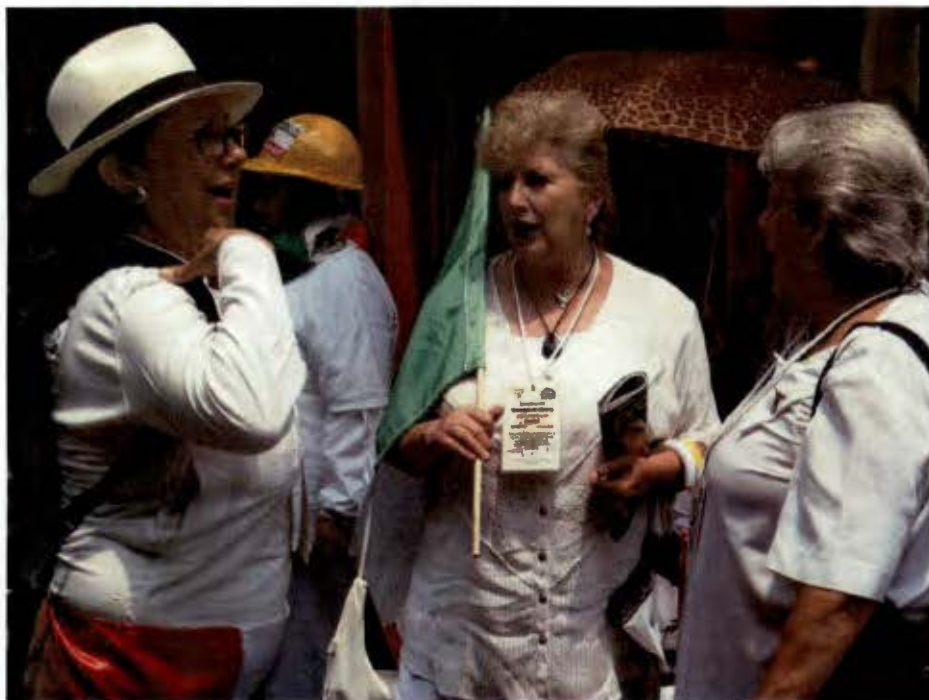
Escenas durante el cerco al Senado. La pluralidad de actrices (Marzo 2008).