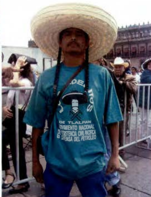
Los personajes de la protesta. Imagen superior izquierda Hemiciclo a Juárez. Imagen superior derecha e inferior izquierda Zócalo Capitalino. Imagen inferior derecha frente a la Torre del Caballito (Marzo 2008).