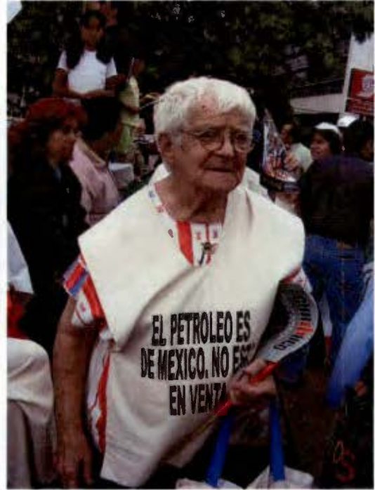
Vehículos de comunicación. Imágenes superior izquierda y derecha Hemiciclo a Juárez. Imágenes inferior izquierda y derecha Zócalo Capitalino (Marzo 2008).