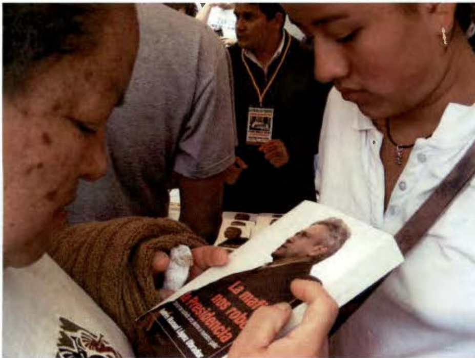
En la compra del libro La mafia nos robó la presidencia (Junio 2008)