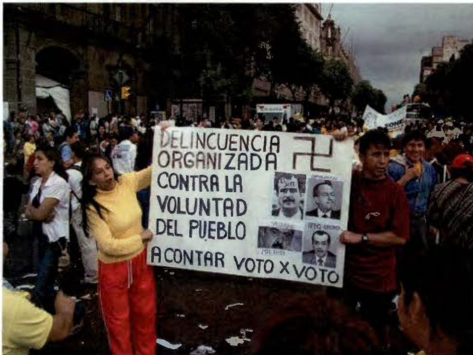
Las protestas contra el fraude, la exigencia del recuento de votos (Julio 2006)