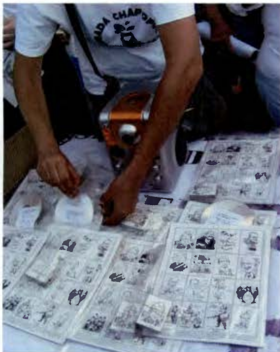
La distribución de la Información alternativa (Marzo 2008)