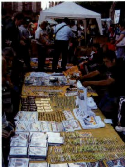
Circuitos de comercio y merchandising. Imagen superior izquierda Zócalo Marzo 2008. Imagen superior derecha Zócalo capitalino Noviembre 2010.