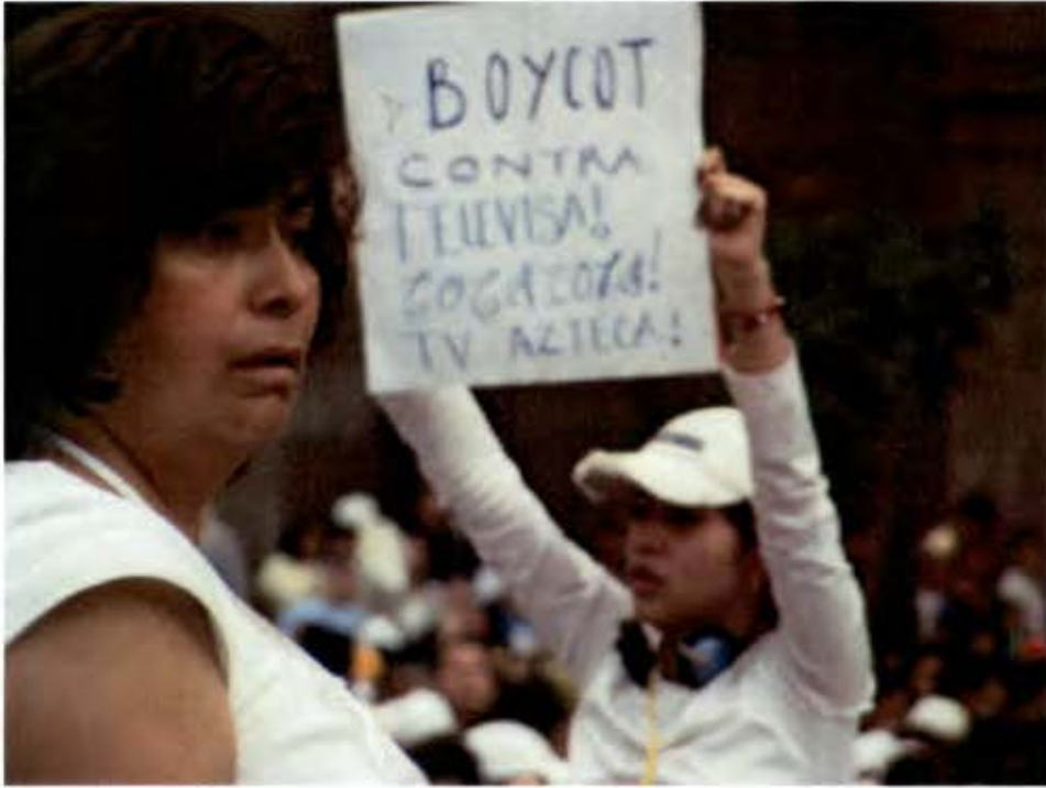
Como parte de la protesta se propone boicotear a las empresas que consideraron fueron partícipes del fraude (2 marzo 2008)