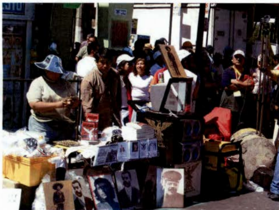
Los emblemas. Febrero 2008