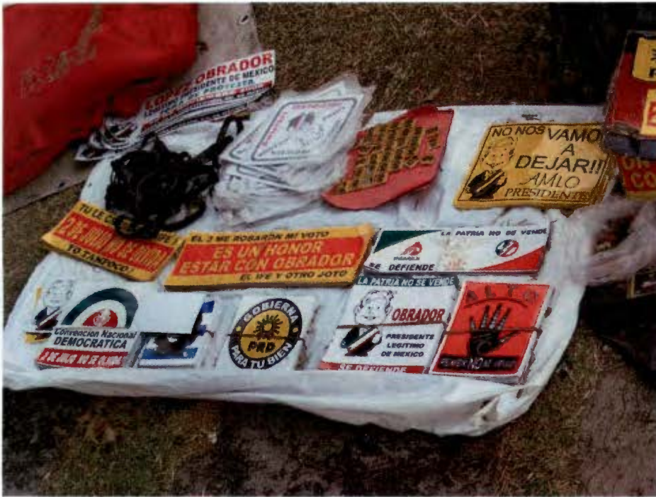
Insignias que representan una postura política. Arriba Fuente de Petróleo Marzo 2008. Imagen inferior izquierda, venta de pines Zócalo de la C.d 20 de Noviembre 2010. Imagen inferior derecha Adelita Alameda central Marzo 2008.