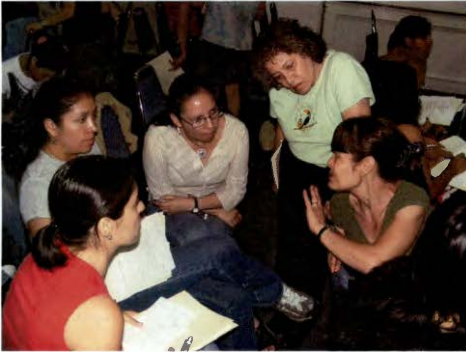
Escena del Curso-Taller Argumentar para persuadir (Marzo 2008).