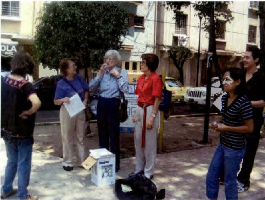
La puesta en práctica de estrategias de interpelación (Abril 2008).