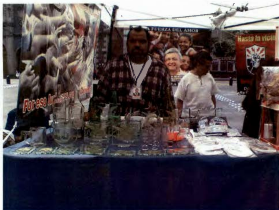
Vendedor de vidrio grabado, Hemiciclo a Juárez, Septiembre 2010.