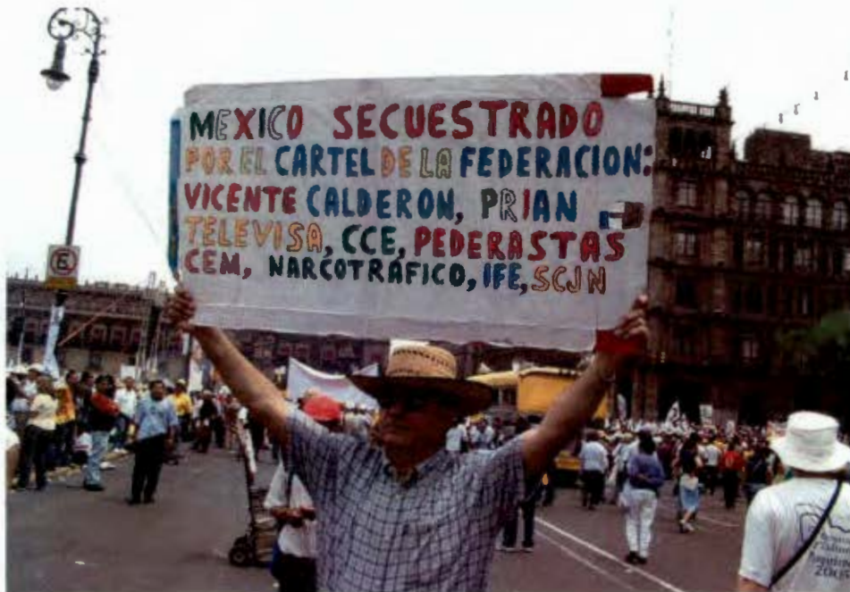
La identificación del enemigo (Marzo 2007)