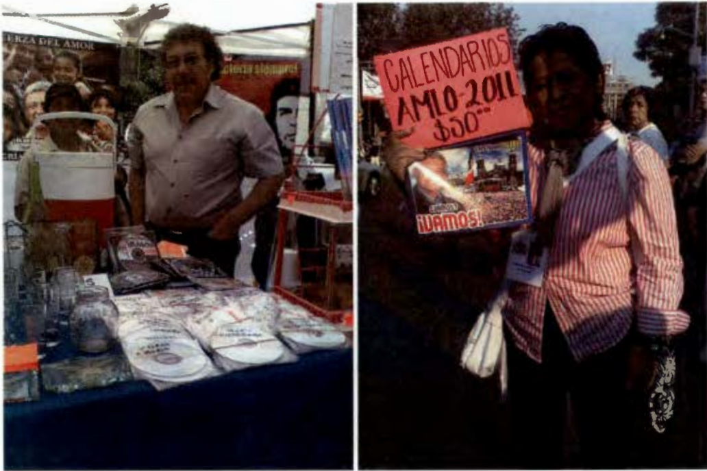
Los vendedores de la Resistencia. Imagen superior izquierda vendedor de cine documental. Imagen superior derecha. La historia se actualiza. Ambas Septiembre 2010 Hemiciclo a Juárez.