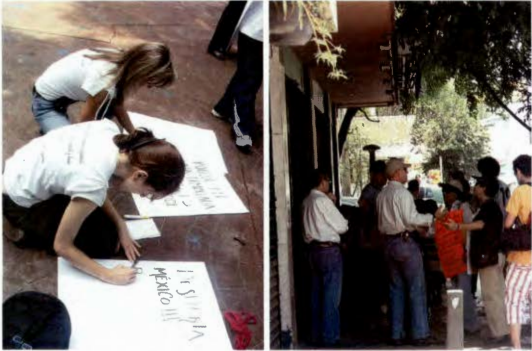
Brigadeo en la Condesa. Imagen Izquierda elaboración de pancartas. Imagen derecha la interpelación a otros (Mayo 2008).