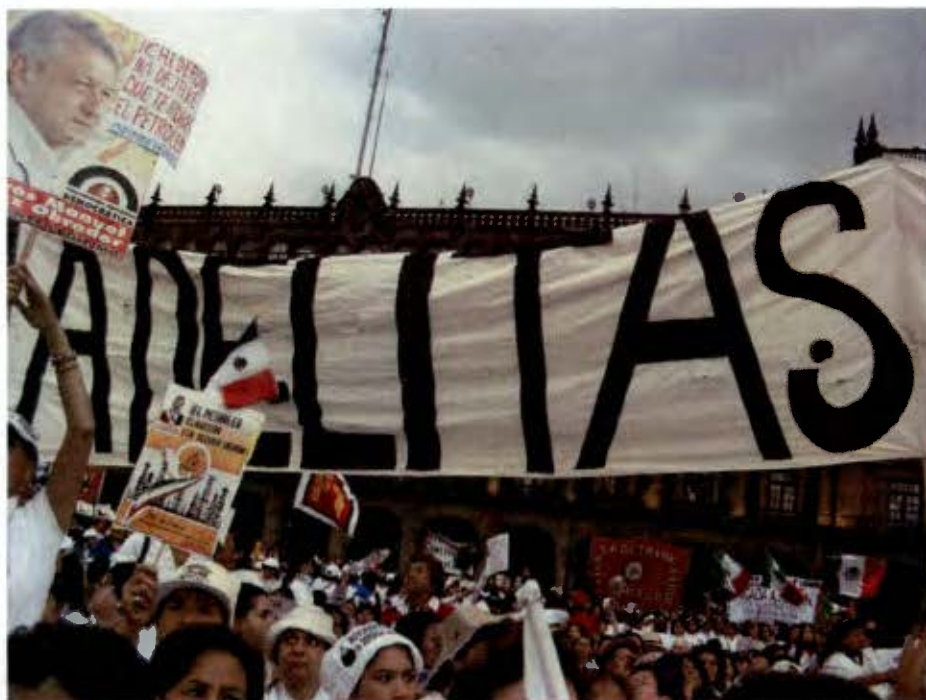
Toma de protesta de las Adelitas, mujeres en la defensa del petróleo (Marzo 2008).