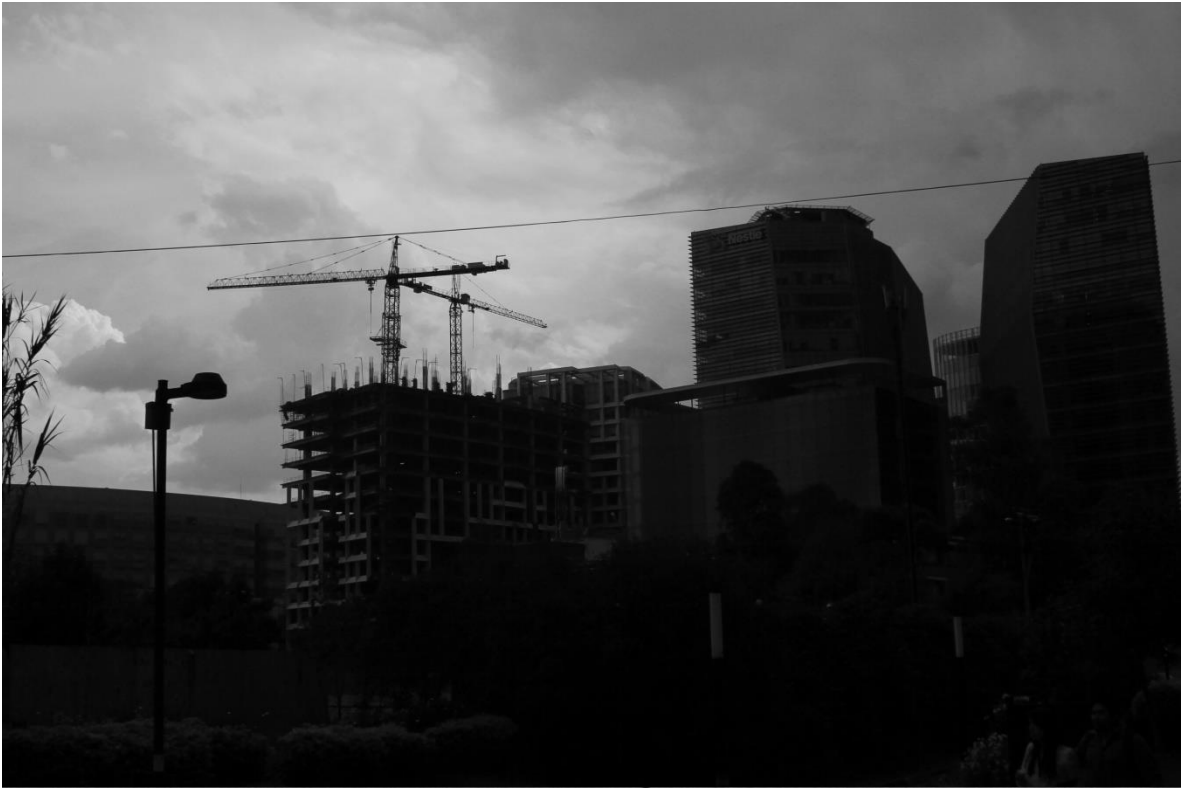
Imágenes de la zona en cuestión capturadas en Mayo de 2016.